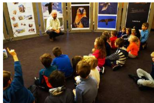
Présentation de l'audio-livre « Gypa » aux écoles