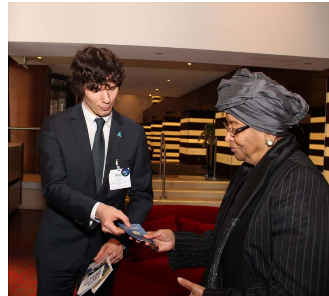
Ellen Johnson Sirleaf - Présidente du Libéria