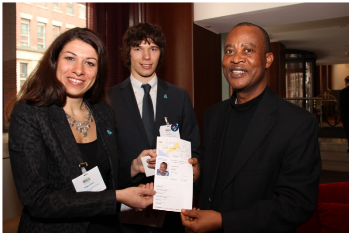
Samuel Kofi Woods - Ministre des travaux publics au Libéria